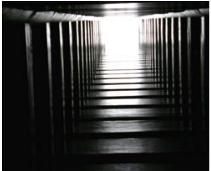
Nya Karolinska är ett exempel på OPS lösning och Skanska har föreslagit en HH förbindelse med hjälp av OPS.

Tidigare har OPS varit politiskt stöd men i takt med investeringsbehoven ökar och resurserna tryter, har inställningen ändrats från politiken. Så kan läget bäst beskrivas.