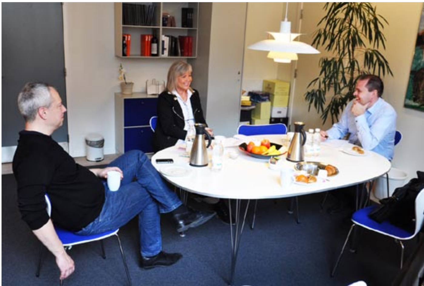
Det skrattades runt bordet som det brukar ske när goda vänner träffas.

Det är alltid skoj att komma på besök och det är alltid lika trist att behöva vända hemåt igen efter ett besök i goda vänner sällskap på Christiansborg. Det är därför glädjande att jag fick en inbjudan med mig hem som innebär att jag snart får träffa alla igen en hel helg.