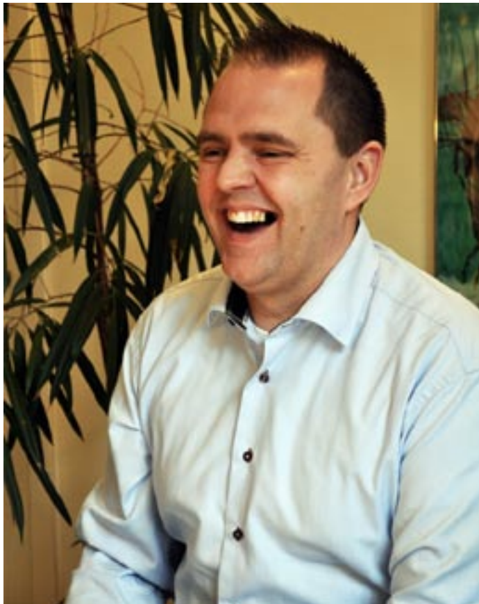
Lillkillen på hal is och själv hade jag trevligt när jag var iväg och höll utbildning.